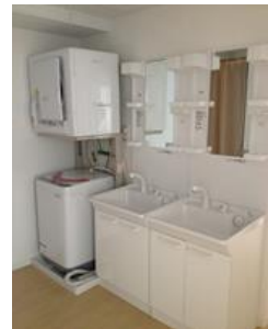
単身室ルームシェア型 / Single room unit type